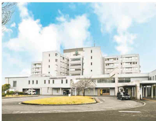
国際医療福祉大学市川総合病院

4月1日(水)、菅野にある東京歯科大学市川総合病院が運営法人の変更により「国際医療福祉大学市川総合病院」として開院、国府台の国際医療福祉大学市川病院が「国際医療福祉大学市川メディカルセンター」に名称を変更した。この2つの病院が連携し、高度で質の高い医療提供に取り組む。