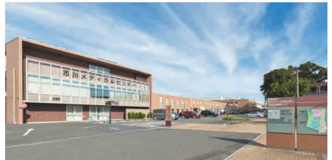
国際医療福祉大学市川メディカルセンター

2つの病院はこれまで地域医療を支えるために連携してきたが、同じグループ病院になったことでこれまで以上に医師の交流や情報交換、患者の受け入れなどでの連携強化が期待される。