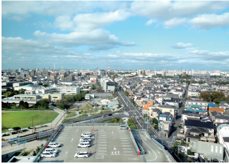
▲浦安市役所からの眺め

千葉県でも所得層が高く、幅広い年齢層が暮らしている浦安市。大型マンションが多いのも特徴。その浦安市全域に30年以上、毎週ポストで配布しているコミュニティペーパーです。