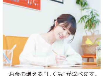
お金の増える「しくみ」が学べます。

こんな人はご参加を ●お金を貯めるコツってあるの？ ●老後資金はどのくらい必要なの？ ●国の動ける資産運用は安全なの？ ●退職金はどうするのが良いの？ ●「NISA」や「DeCo」に興味がある ●はじめてマネーセミナーに参加する