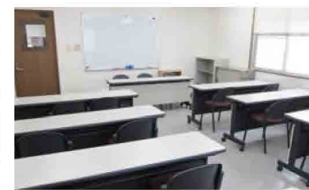
3つのセミナールームは連結利用可能