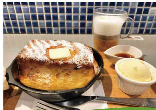
フレンチトースト(ドリンク付き)

溶け流れたバターが鉄板の上でジュワジュワ。音と香りに気持ちは前のめり。まずはそのままひと口、外はカリッとして、中はスフレのようなフワトロ食感。底のおこげはバターを吸って濃厚! バニラアイスと一緒に食べると温度差が醸し出す旨さがあり、苦味の効いたカラメルソースをかければ、プリンのように! アイスとカラメルソースは小皿で別添えなので、上に乗せてよし、別々に食べてよし。自分好みにできるのがうれしいです。ミルクたっぷりのカフェラテと共に、最後までアツアツのままいただけました!