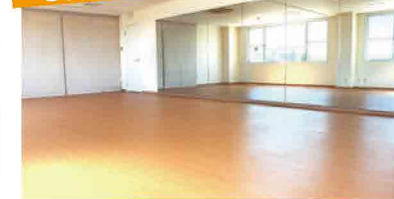
大きな窓から日差しが入るスタジオは明るく開放感満点