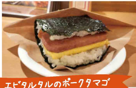
エビタルタルのポークタマゴ

ねり梅(50円)明太子(150円) こぼろサラダ(150円)など トッピングも充実! 自分好みに カスタマイズしたくなりますよ! ※全て税込