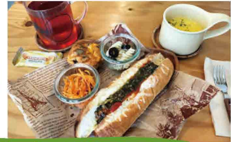
パンプレート(ドリンク付き)

体調や気分に合わせて 調合してくれる「パーソナルブレンド (税込み500円)」も人気。 11月頃までは、自家栽培の生ハーブを 使用することもあるとかよ!