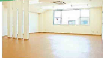
可動式大型ミラー付きの広々としたスタジオ