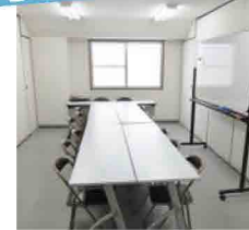
趣味の講座や会議に!