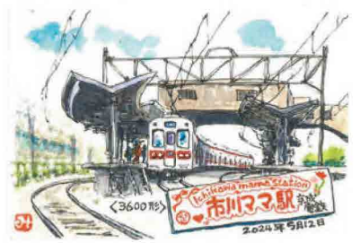
百田さん描き下ろしのオリジナル「電車カード」

グッズ販売会では、京成電鉄、いちベジ(JAIいちかわ)、銀河コーヒー 市川真間店、ポローニヤ市川、市川まちガチャ実行委員会、千葉商科大学が出店を行う。京成電鉄の物販スペースでは「市川ママ駅 次駅名付駅名看板キーホルダー」「市川ママ駅 補助駅名看板キーホルダー」を、数量限定(税込み1000円/各300個)で販売する。また「京成パンダ」「いちかわうそ君」「パンディ」などのキャラクターたちも登場し、グリーティングが行われる予定。