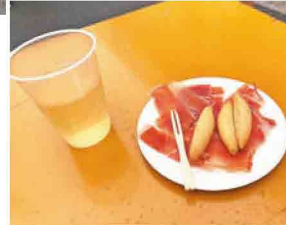
各店自慢の食べ物や飲み物が揃う