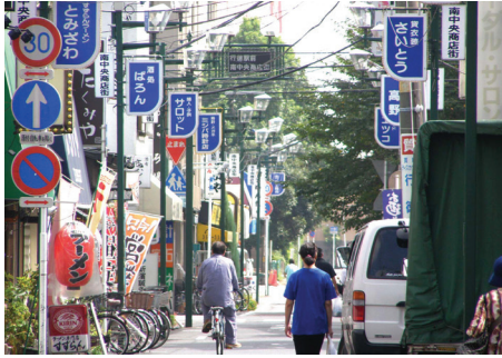
▲行徳駅前南中央商店街

大手町、日本橋まで30分のこのエリアは、全国から引っ越してきた20代～40代の若いファミリー世帯が多く住む街。転入・転出も多くあり、住む人が入れかわる活気のある街でもあります。